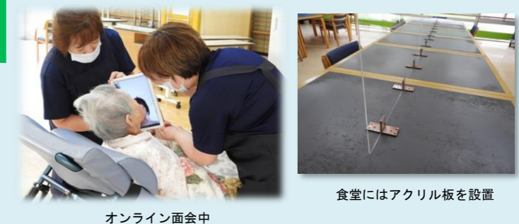
オンライン面会中