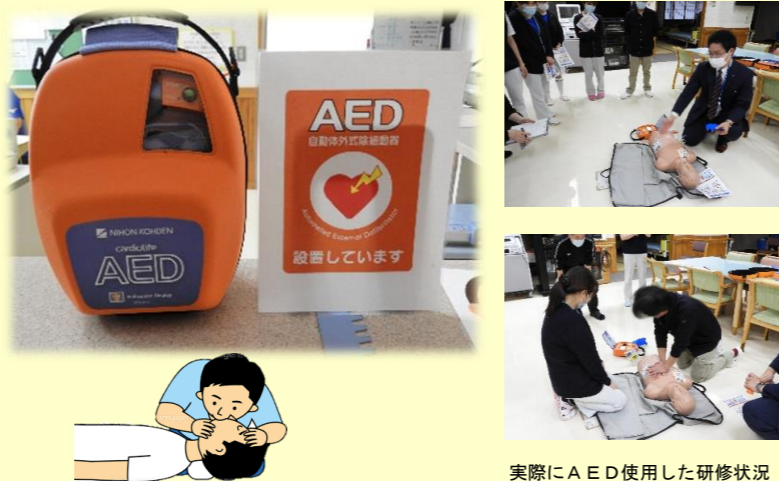
実際にAED使用した研修状況

大成長生園では昨年度よりAED（自動体外式除細動器）を設置いたしました。AEDは突然の心臓停止状態に陥った時、心臓に電気ショックを与える医療機器であり2004年より法律の定めで一般の人でも使用できるようになりました。AEDは心肺停止から5分以内に行うことが基本で心肺停止から5分以降1分遅れるごとに7～10%生存率が下がると言われております。大成長生園（宮野）まで救急車が到着するには6、7分かかると思われるため、救急時のAED使用は有効な応急手当になると考えられます。