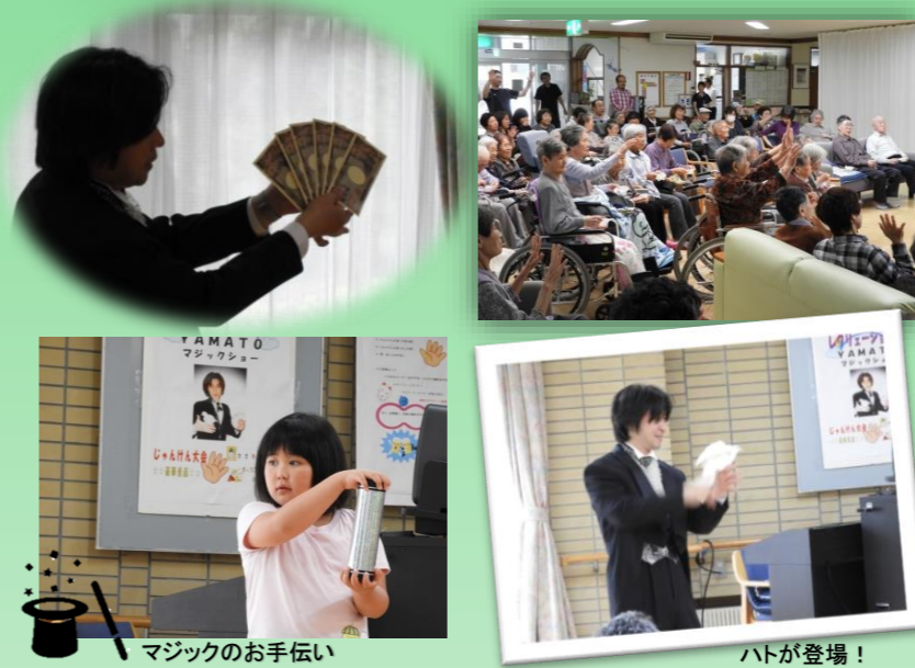
マジックのお手伝い

長生園最大のイベント「レクレーション会」が7月1日に開催されました。あいにくの雨により施設内ロビーでの開催となりましたがYAMATOさんのマジックショーが披露され多に盛り上がりました。最後に恒例のじゃんけん大会が行われ、利用者の皆さんや来場されたご家族にとって楽しい一日となりました。また、今年のレクレーション会は、宮野町内会の皆様にご参加、ご協力をいただきました。誠に有難うございました。